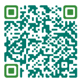
รายชื่อสถานที่จำหน่ายไข่